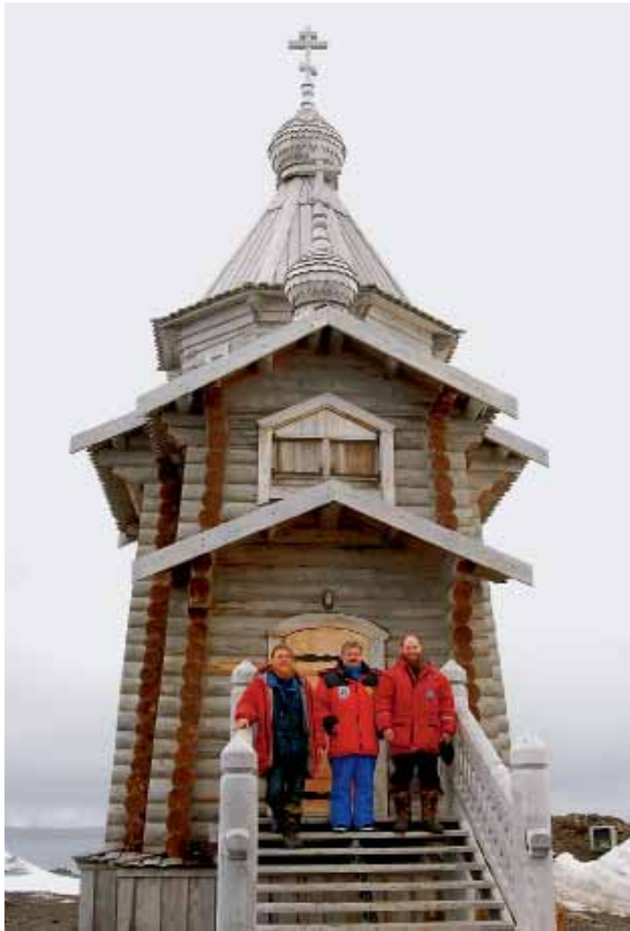
Церковь в Антарктиде