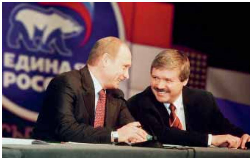
С В.В. Путиным