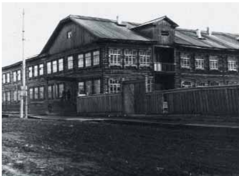
Моя первая школа