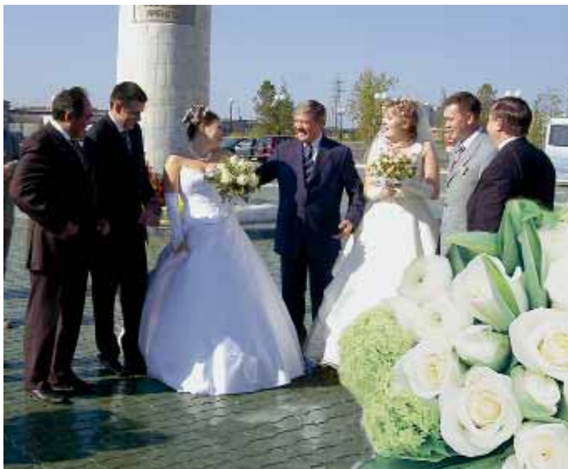
С молодоженами Нового Уренгоя