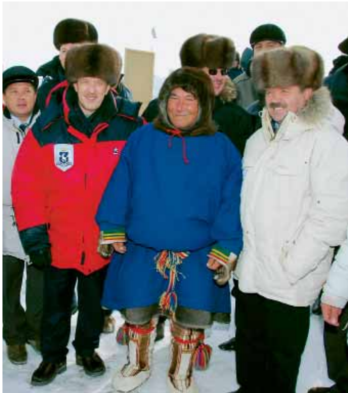
Северяне встречают гостей