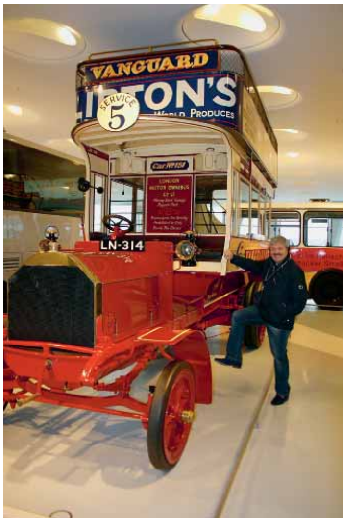
В музее Mercedes. Штуттгарт