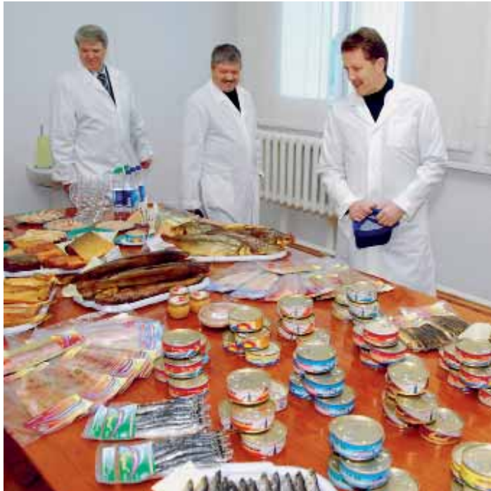
Накормим всю страну