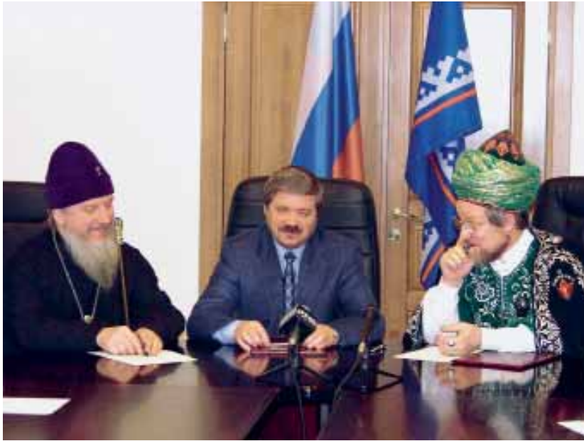
С Архиепископом Тобольским и Тюменским Димитрием и Верховным муфтием Центрального духовного управления мусульман России Талгатом Таджуддином