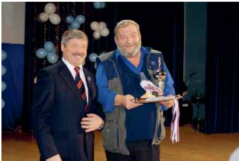
С дядей в Тарко-Сале