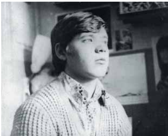
Старшеклассник – мечтатель