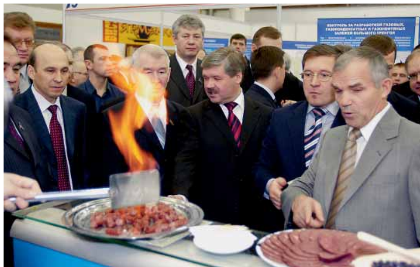
Дегустация ямальских деликатесов