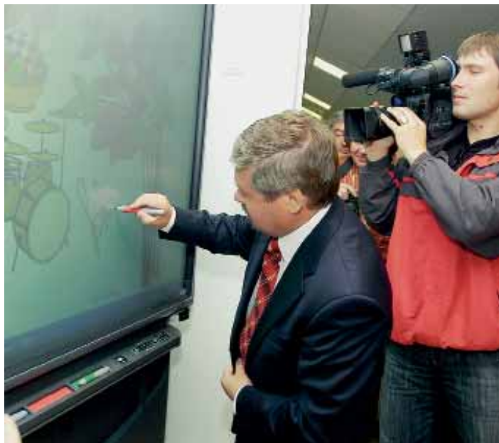
Рисую на интерактивной доске