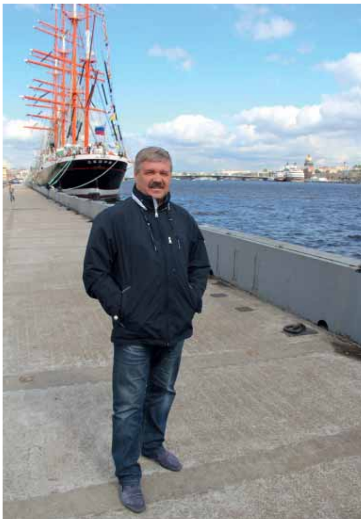
Проводы барка «Седов» в кругосветку. Май 2012 г.