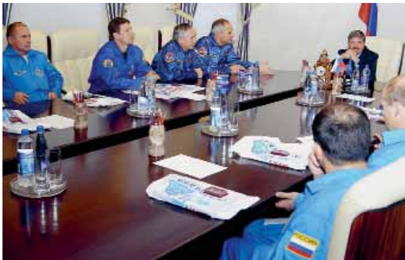
«Витязи» на Ямале