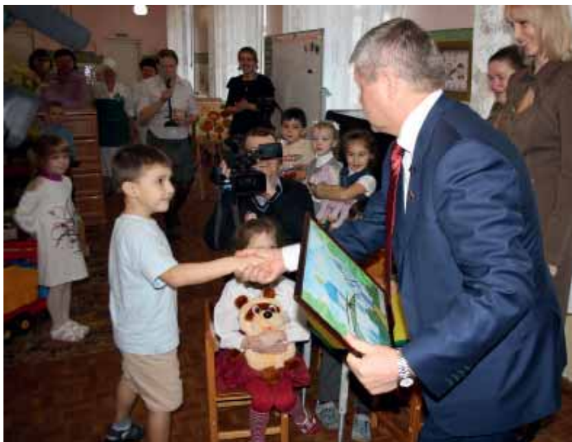
Подарок от юного художника деревни Неёлово