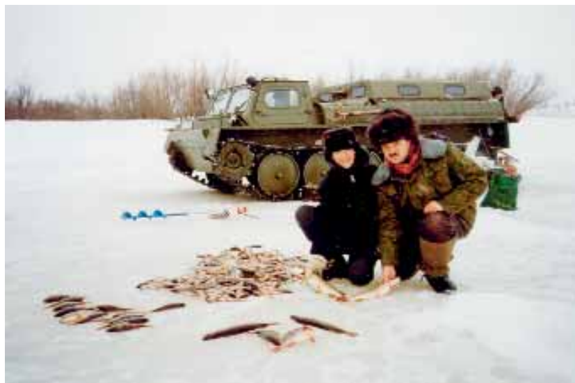
С сыном на рыбалке