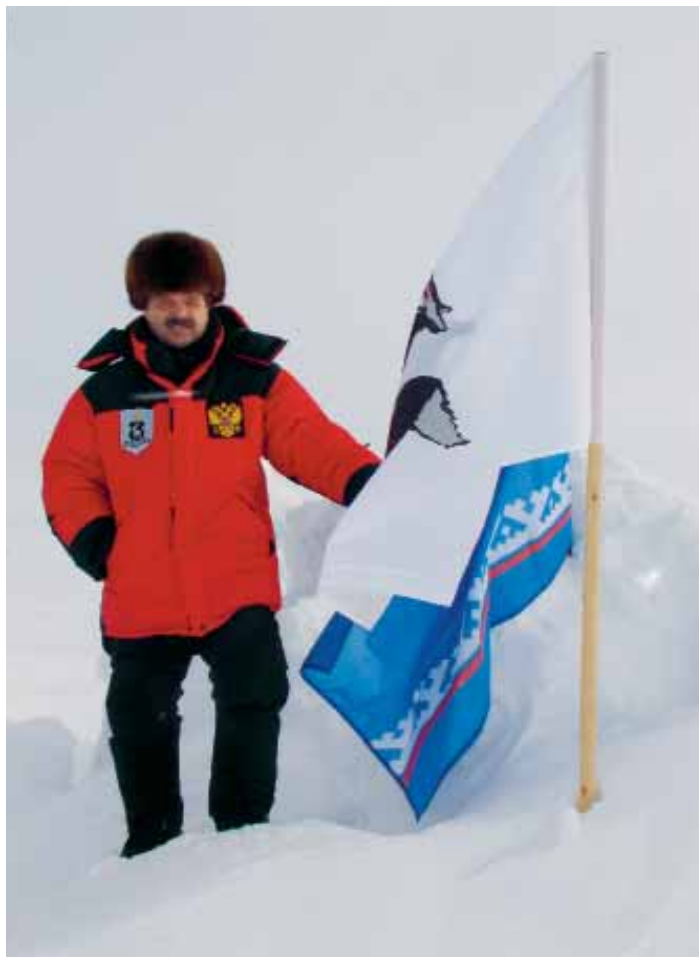
На верхушке мира