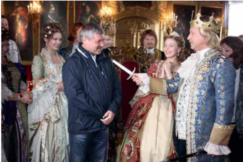
На съемках фильма «Тайна Снежной королевы»