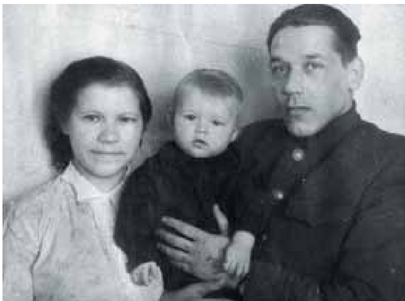
С мамой и папой