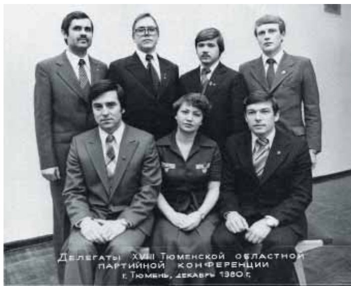
В составе делегации