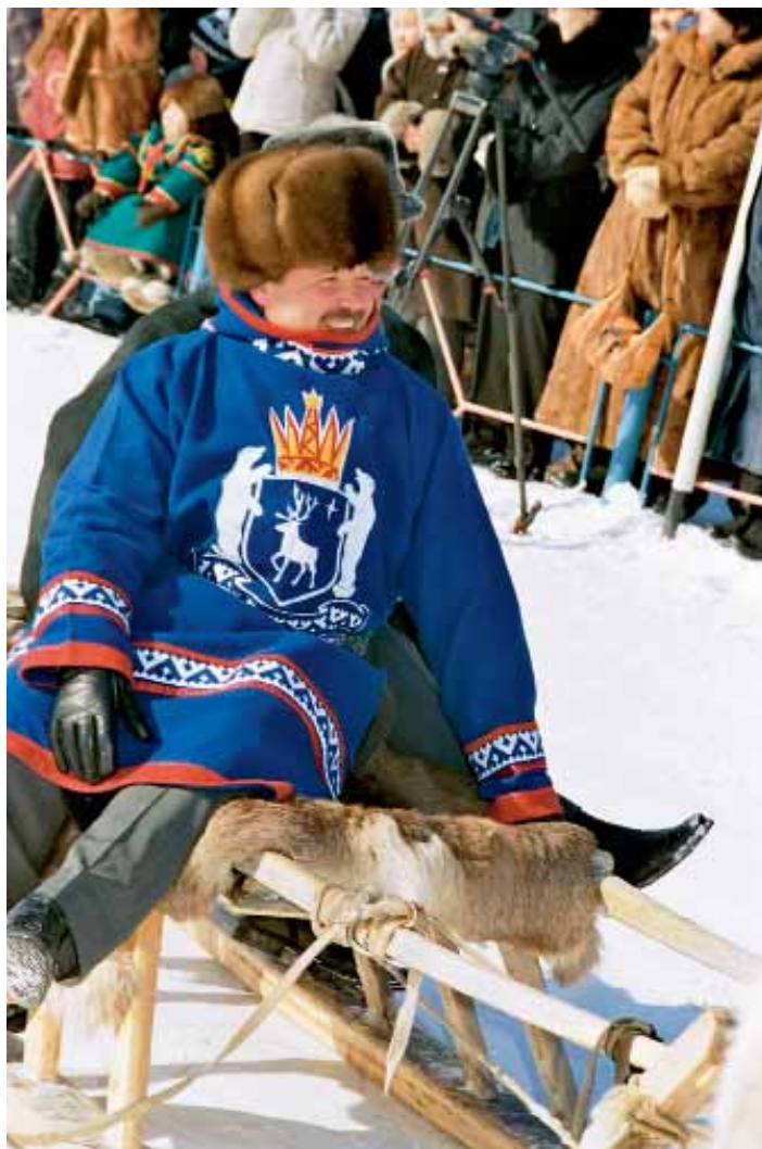
А на оленях лучше