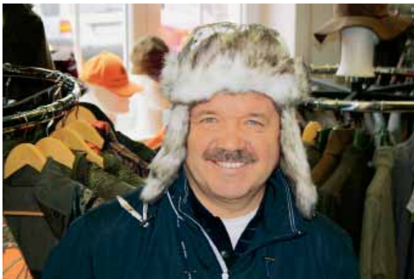
Шапка для охотника