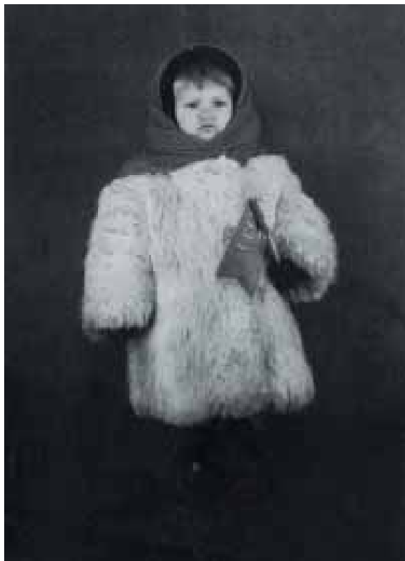
Мой первый праздник