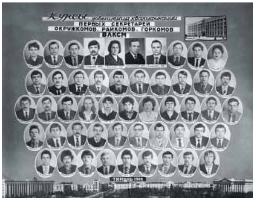
Комсомол – моя судьба