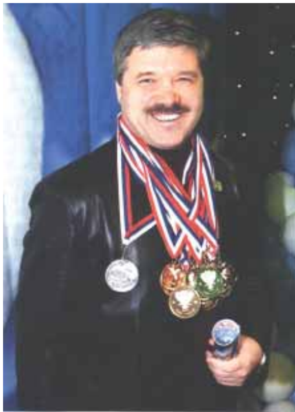
Награды за «голубиное хобби»