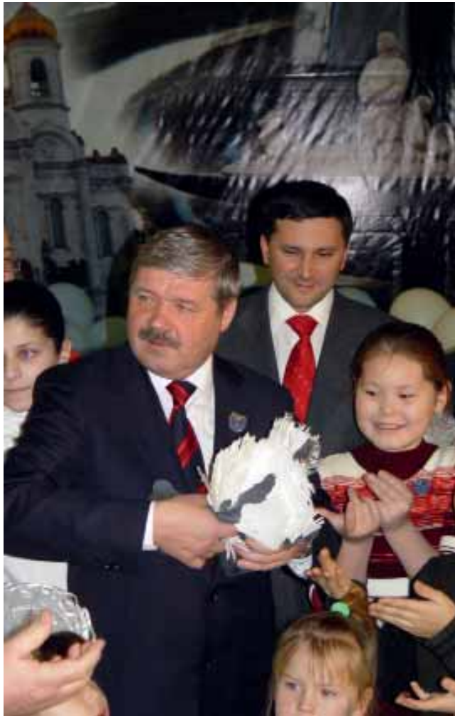
С символом мира