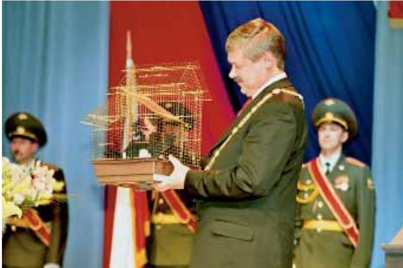
Лучший подарок... голубь! Инаугурация