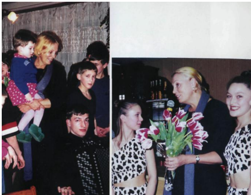
В детском доме «Семья». г. Сургут