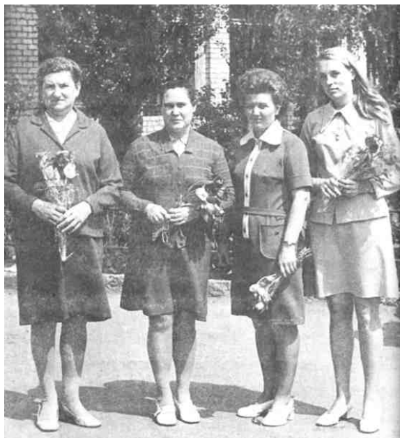
Первый год учителвя, 1975 г.