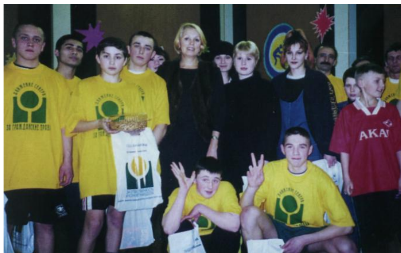
Акция « Спорт вместо наркотиков». Сургутский район