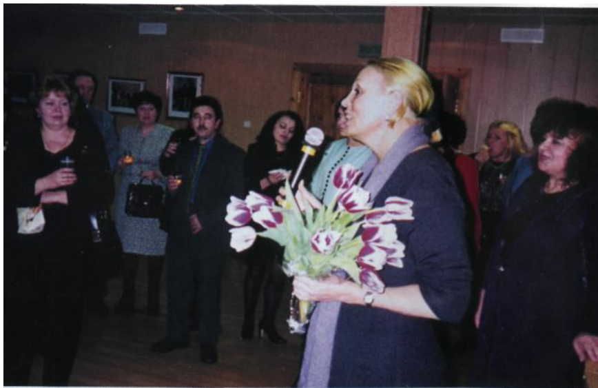
На встречах с женщинами. БельйЯр