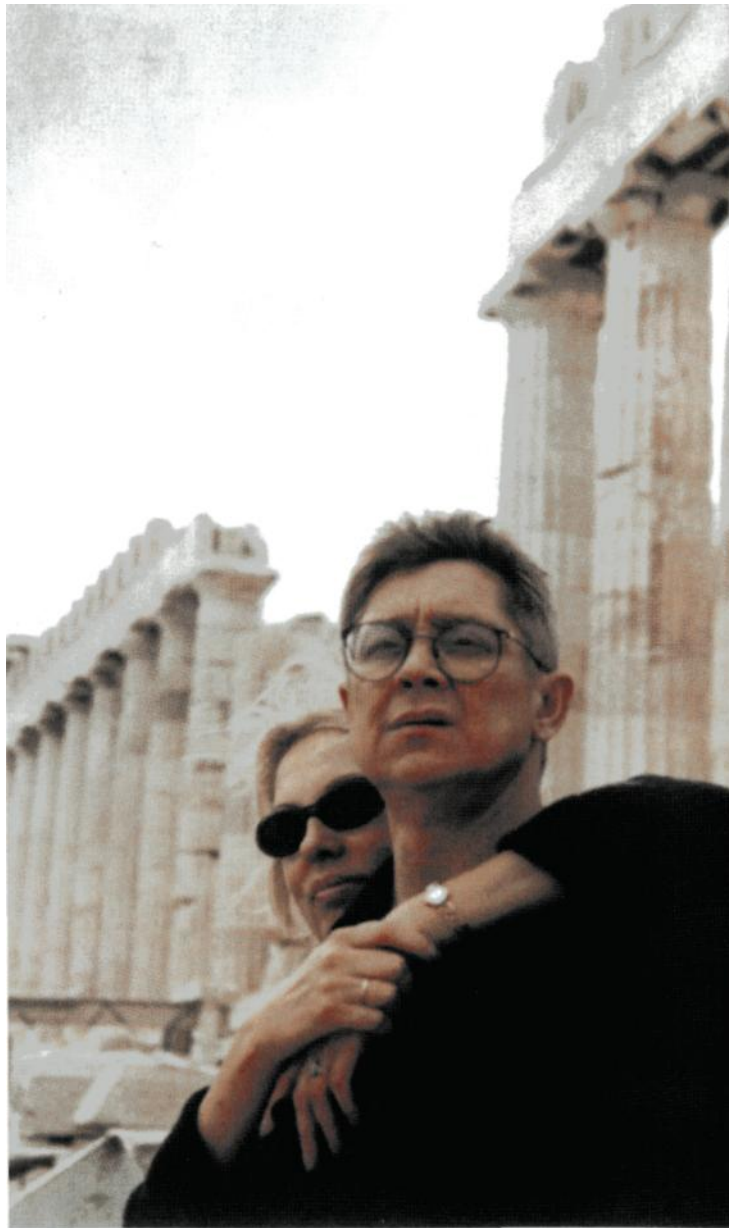
Редкий отдых вдвоем. 1996 г.