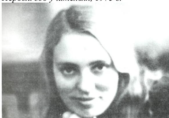
"Заместитель директора по воспитательной работе. 'Сургут, 1977 г.