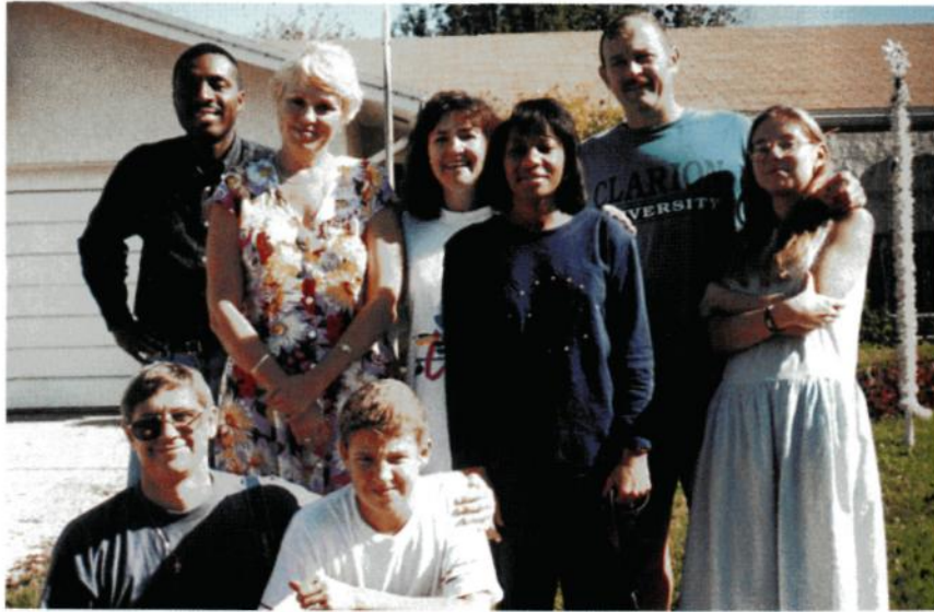
Гостям всегда рады. Моя семья и студенты в Горячем Ключе. 1995 г.