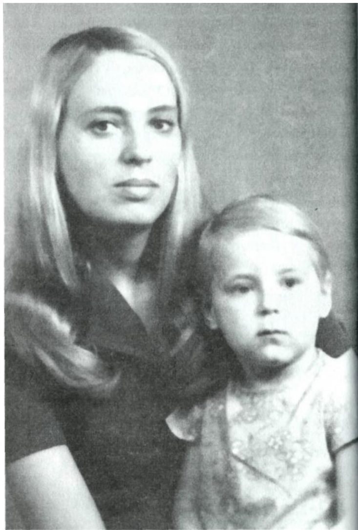
Сургут, 1976 г.

думала, что не выкарабкается, она попросила меня: «Если что со мной случится - вырасти мою дочку». Слава богу, все остались живы и здоровы, но эти слова я буду помнить до конца моей жизни.