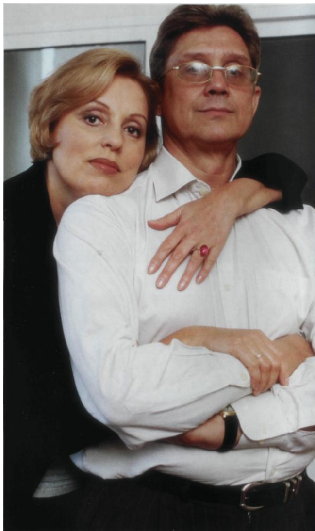
«Вот так и живем...» 1998 г.