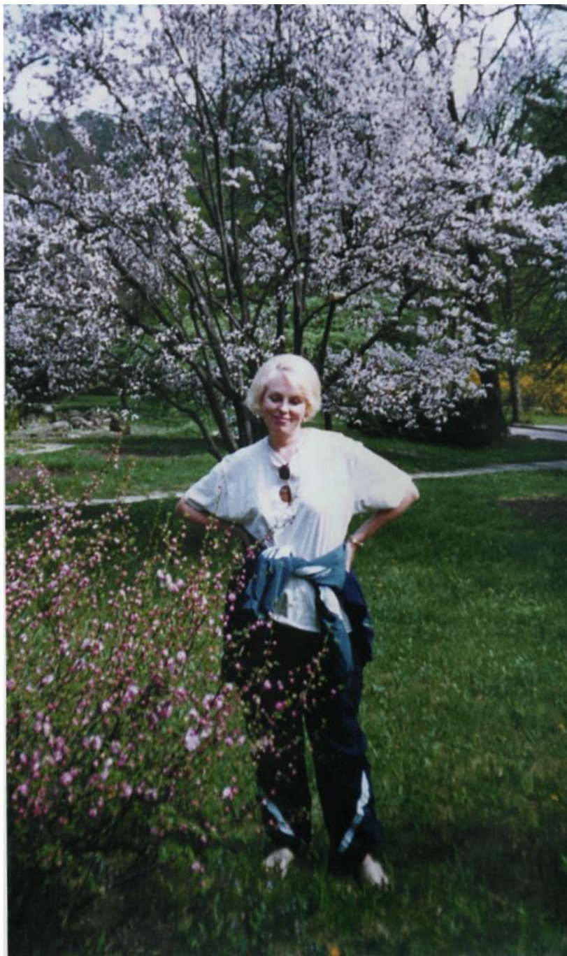
Весна... 1997 г. Горячий Ключ, Краснодарский край