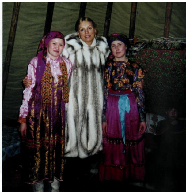
В национальном музее г. Ханты-Мансийск