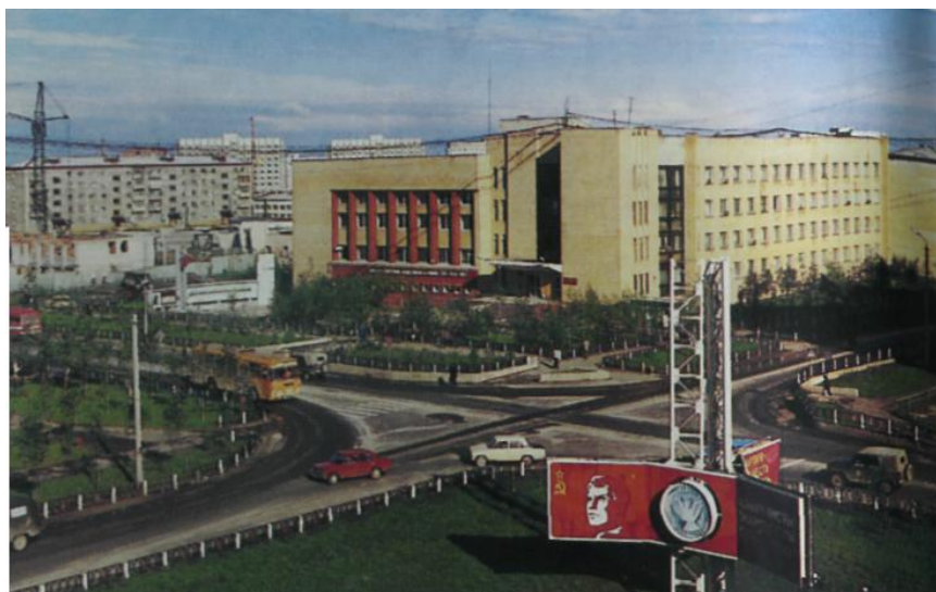
г. Сургут, 1989 г.

проигнорировать все, что не совпадает с ее настроением или мнением. Добра, общительна и незлопамятна. В любой компании заражает весельем, хорошая жена, хозяйка, мать. Пожалуй, в общих чертах мой портрет перед вами.