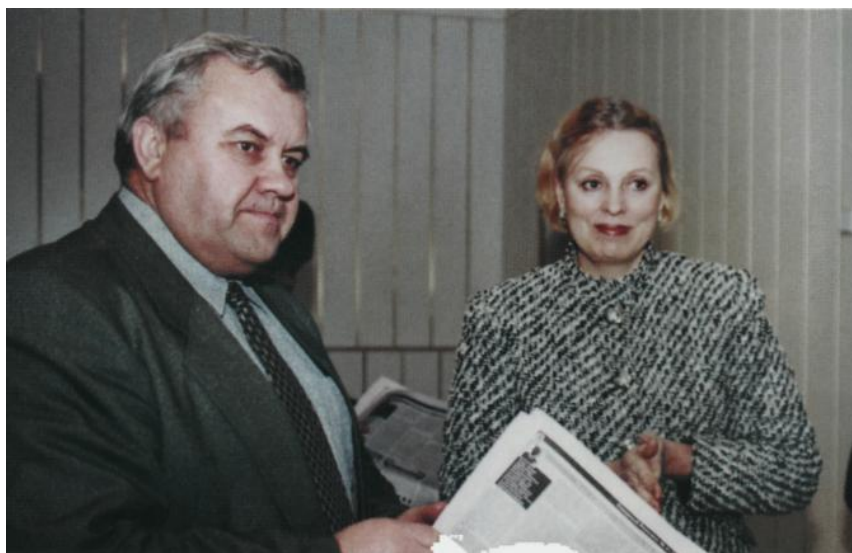
Читаем «Северный резонанс»