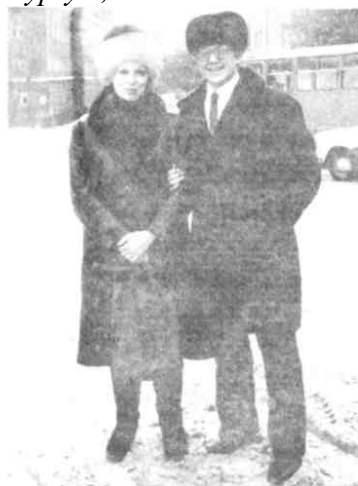
Сургут, 1981 г.