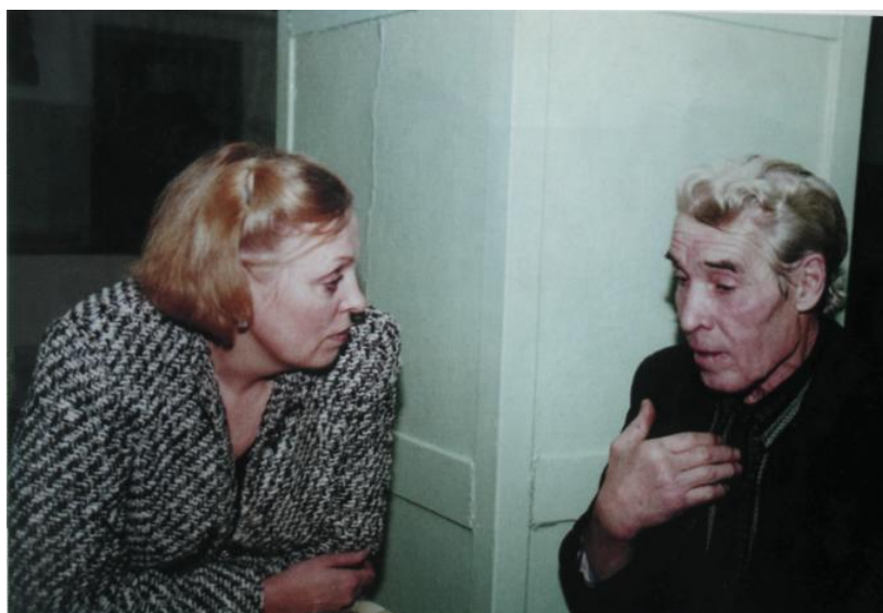
г. Нефтеюганск, 1999 г. На встречах с ветеранами