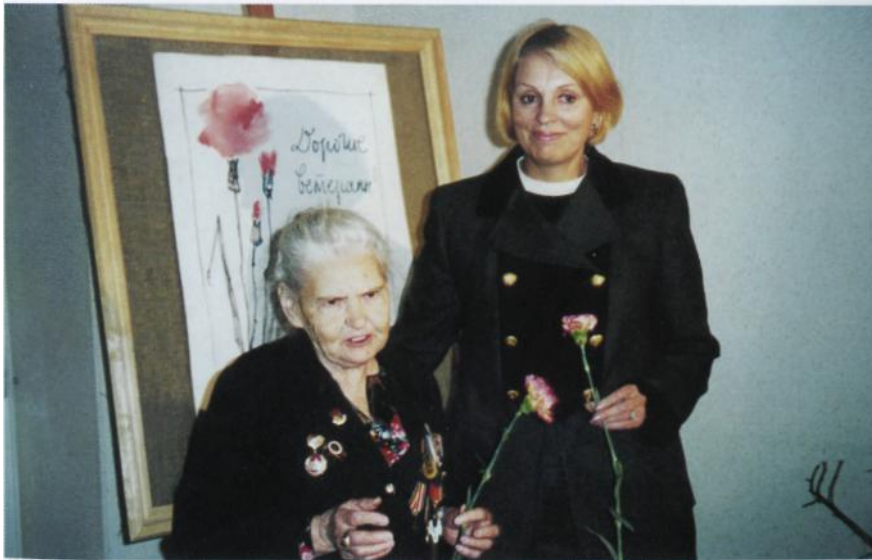
г. Нефтеюганск, 1999 г. На встречах с ветеранами