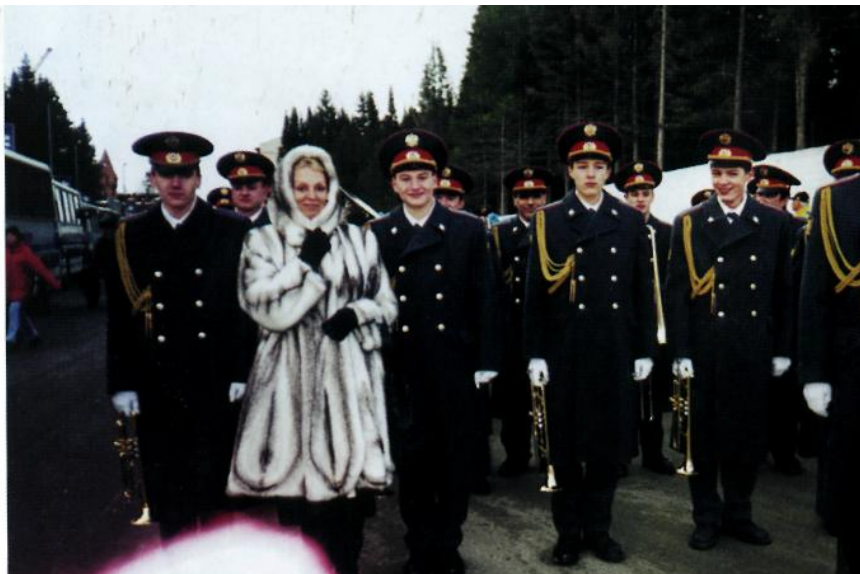
На военном параде. г. Ханты – Мансийск.