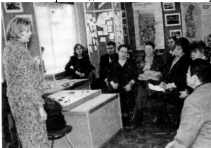
Ветрена с избирателями, 1999 г.

Первый номер нашей газеты «Северный резонанс» вышел накануне Дня учителя, что было для меня очень символичным, и здесь же я опубликовала свою программу и обратилась к читателям с просьбой дополнить ее замечаниями и предложениями.