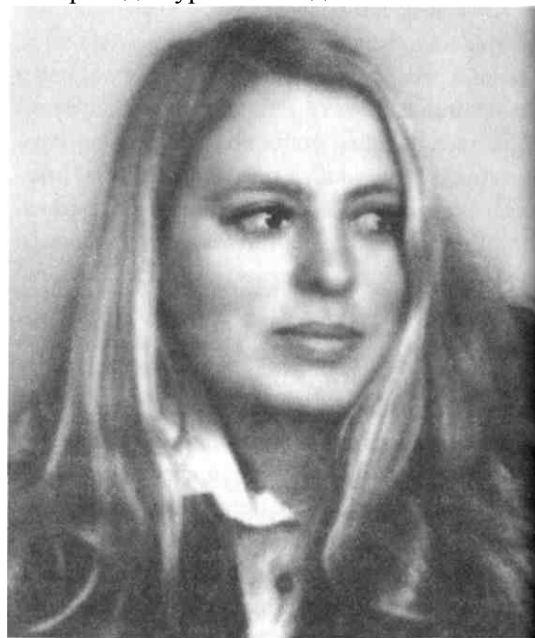
Первый год в Сургуте, 1976г.