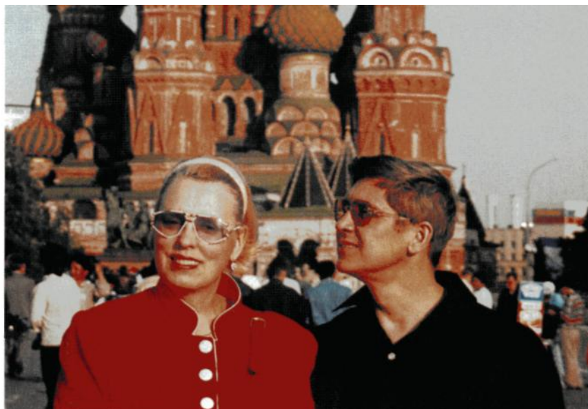
Москва. Красная площадь. 1994 г.