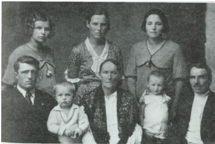
Мой дед и три его дочери. В центре - моя мама (младшая)