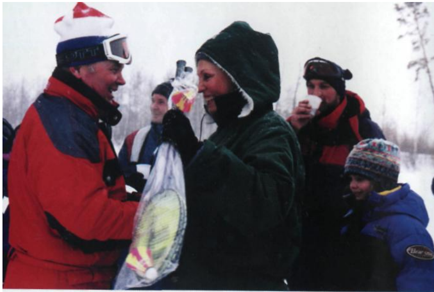
Поздравляем победителей. Барсова гора. г. Сургут